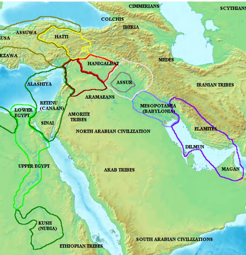
قلمرو قدرت های پادشاهی در بین النهرین

سرانجام ارتش های متحد بابل و ماد در ۶۱۰ ق. م وارد نینوا پایتخت آشور شده، پس از هلاک آشور بانپال پادشاه آن، نینوا را چنان با خاک یکسان می کنند که یکسال بعد وقتی ده هزار درنده